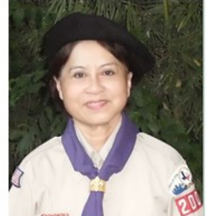
MÂN N. LA