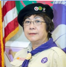
MỸ LỘC ĐỖ