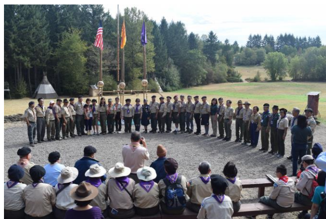
CÂU CHUYỆN ĐẦU TRẠI