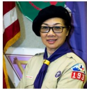
CHU BẠCH YẾN