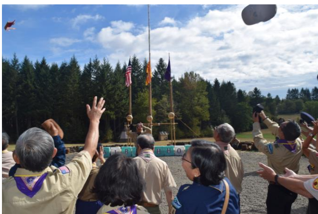
CHÀO MỪNG KHAI MẠC TRẠI